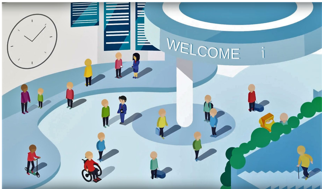
Animasjon: Animer for AKT

Å bidra til å endre folks reisevaner, handler om å forstå forbrukeratferd og de reisendes behov og preferanser. Vi er bevisste på at alt vi gjør skal ha en universell utforming og inkludere alle grupper av reisende. En reise starter og slutter ved våre terminaler og holdeplasser. AKT har et betydelig ansvar for at inngangen og utgangen på en kollektivreise oppleves positivt slik at de reisende vil foretrekke dette som løsningen på sitt reisebehov i fremtiden. Det er vår visjon og vårt samfunnsbidrag.